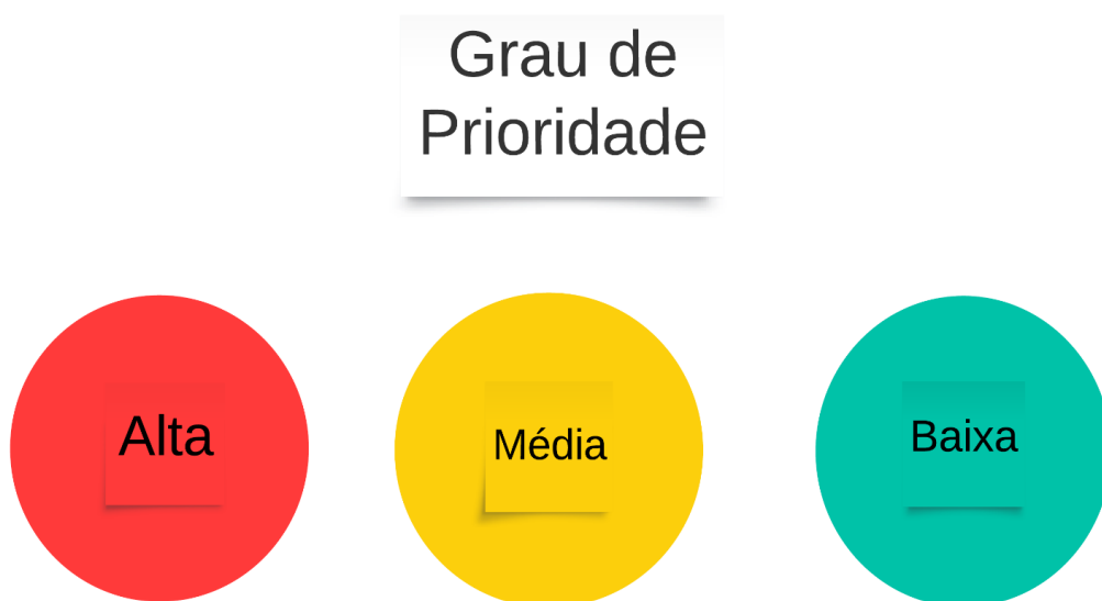
Figura 2 - Grau de Prioridades

Para definição das necessidades foi utilizado a metodologia de matriz de GUT, conforme figura abaixo: