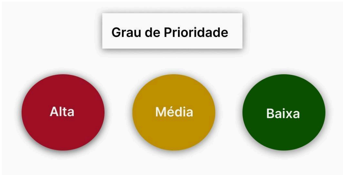
Figura 2 - Grau de Prioridades

Para definição das necessidades foi utilizado a metodologia de matriz de GUT, conforme figura abaixo: